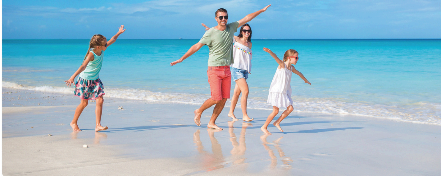
Résidence Ker Goh Lenn*** - Morbihan